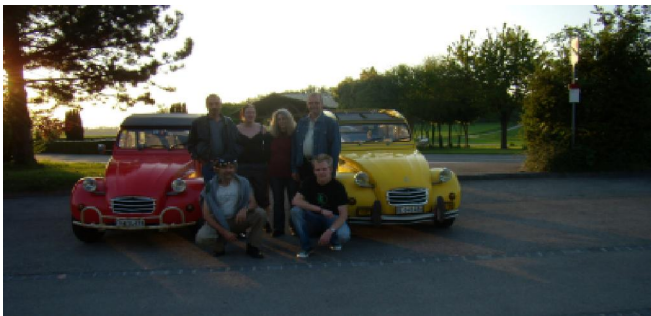
Das OK bei der Gründung am 08. Mai 2008 in Cordast

Bei der Gründung am 8. Mai 2008 sind wir bloss eine Handvoll Mitglieder gewesen, die meisten davon im Vorstand. Mittlerweile haben sich uns laufend neue Mitglieder angeschlossen. Unsere Mitglieder kommen aus allen Ecken der Schweiz, zum Beispiel aus Luzern oder dem Waadtland.