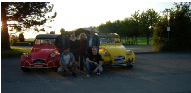
Le Comité lors de la fondation à Cordast

Le Club «...deuchmilleneuf» se situe, sciemment bilingue, précisément sur le Röstigraben et communique, si nécessaire par dessus de celui ci. Le nom que nous avons choisis est un jeu de mots entre deuche et deuchmilleneuf.