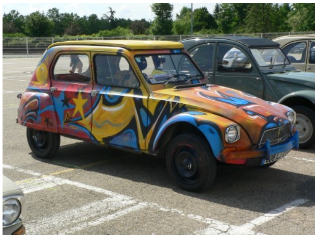
Très belle Diane "dans leur jus" de 1968

En 1937 déjà, dans les usines Citroën, les premiers prototypes de la légendaire 2CV apparaissent. La deuxième guerre mondiale retarde la production. En 1948, lors du Salon international de l'automobile à Paris, Citroën présente pour la première fois cette voiture.