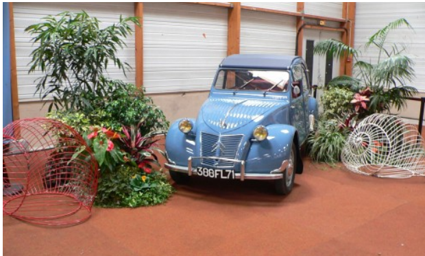
La doyenne des 2CV

En 1937 déjà, dans les usines Citroën, les premiers prototypes de la légendaire 2CV apparaissent. La deuxième guerre mondiale retarde la production. En 1948, lors du Salon international de l'automobile à Paris, Citroën présente pour la première fois cette voiture.