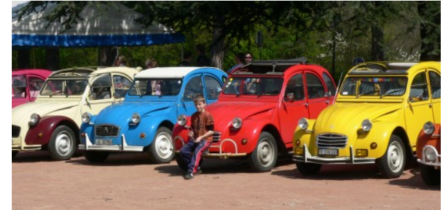
Concentre 2CV à Lyon (F)