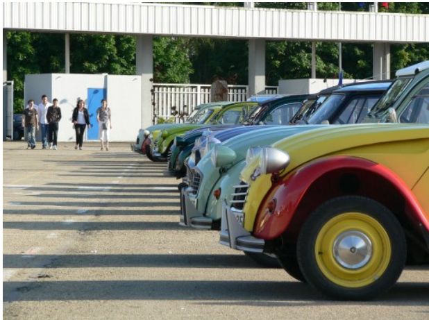
60 ans 2CV et 40 ans Méhari à Macon (F)