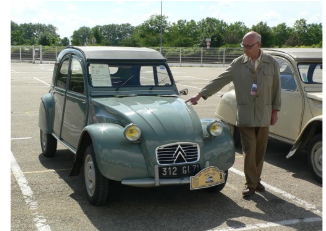
«...entente et passion deuchiste»

La nation comptant le plus grand nombre de 2CV est naturellement la France. Si la scène ne se créa que tardivement, aujourd'hui ils savent organiser des rencontres formidables et ils adorent leur "Deuche". Dans quasi tout les pays européens, il existe des clubs plus ou moins grands. Certains se sont spécialisés sur la Diane, la Méhari etc.