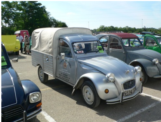
Transformation réussie d'une fourgonnette à Macon (F)

Les "deuchistes" sont mobiles et conviviaux. Tous les deux ans, des Amis de la 2CV du monde entier se rencontrent dans un autre pays en Europe pour une semaine de gaieté autour de la 2CV. La première, et aussi la dixième "concentre mondiale" eut d'ailleurs lieu en Finlande. Les Finnois ont (presque) promis que la "vingtième" aura de nouveau lieu au grand Nord...:-))