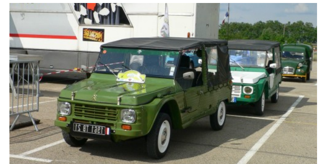
Méhari d'origine de l'Armée Française